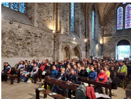
MARCHE DE RENTRÉE EN PAYS DE DINAN, LE 28 SEPTEMBRE DERNIER

2 PHOTOS : L'UNE SOUVENIR, L'AUTRE POUR DÉJÀ NOUS METTRE DANS L'ATTENTE DE NOËL :