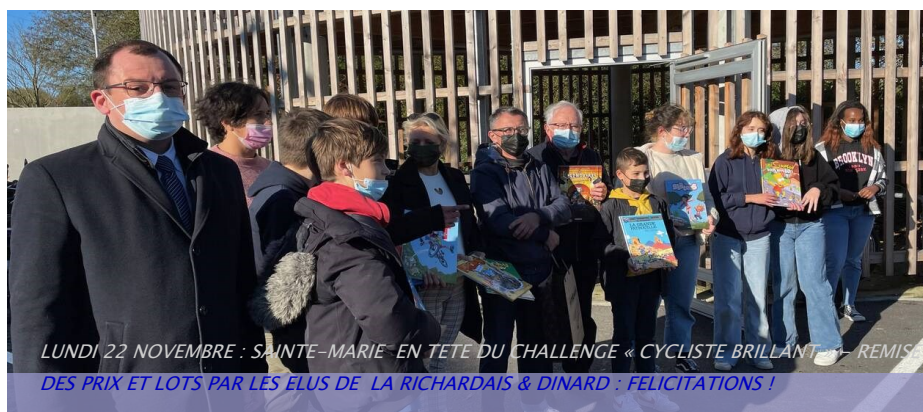
LUNDI 22 NOVEMBRE : SAINTE-MARIE EN TÊTE DU CHALLENGE « CYCLISTE BRILLANT » - REMISE DES PRIX ET LOTS PAR LES ÉLUS DE LA RICHARDAIS & DINARD : FÉLICITATIONS !